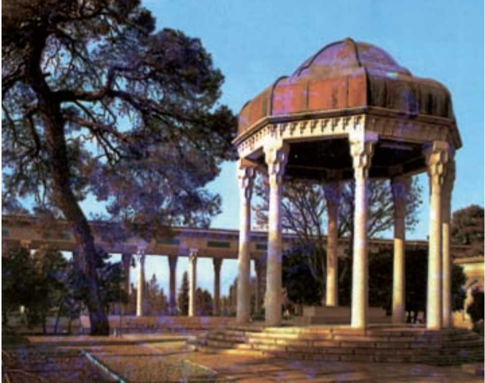
شیراز، آرامگاه حافظ