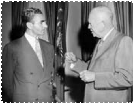
شاه در ملاقات با آیزنهاور رئیس‌جمهور آمریکا

آمریکا که از کمک به دولت دکتر مصدق اجتناب می‌کرد، پس از پیروزی کودتاچیان کمک‌های زیادی در زمینه‌های نظامی و اقتصادی به دولت کودتا کرد. ۱ باروی کارآمدن دولت نظامی زاهدی ۲ ، فضای تیره‌ای در جامعه ایران حکم فرما شد، فرمانداری نظامی تهران به سرتیپ تیمور بختیار سپرده شد. بختیار که افسری بی‌رحم و خونریز بود، برای استقرار و تثبیت حکومت کودتا، سرکوب نیروهای ضدکودتا