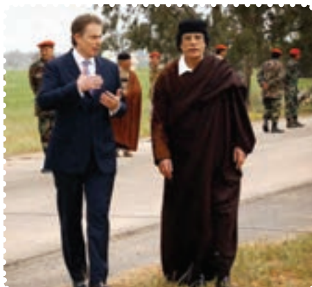
سرهنک قذافی دیکتاتور پیشین لیبی در کنار نخست وزیر انگلستان

کرد. سرانجام پس از ماه‌ها درگیری نظامی با سقوط طرابلس، حکومت قذافی سرنگون و خود او کشته شد. نکته جالب در مورد قذافی این است که وضعیت او بیش از هر دیکتاتوری به صدام شبیه بود. ت) بیداری اسلامی در یمن: جمهوری یمن در جنوب شبه جزیره عربستان واقع است و دارای نژادهای عرب (۸۶ درصد)، ترک، هندی، ایرانی و سومالیایی است. بیش از ۵۰ درصد یمنی‌ها شیعی مذهب‌اند که غالباً در منطقه صعده و شمال یمن ساکن‌اند. البته عمده شیعیان یمن زیدی‌اند که بعد از امام سجاد (ع)، زید بن علی (ع) را امام می‌دانند. مردم یمن در پی انقلاب‌های گوناگون در کشورهای اسلامی، اعتراضات و تظاهرات گسترده‌ای را در شهرهای مختلف علیه رژیم دیکتاتوری علی عبدالله