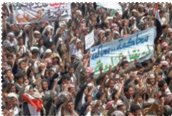
قیام مردم مسلمان یمن

کرد. سرانجام پس از ماه‌ها درگیری نظامی با سقوط طرابلس، حکومت قذافی سرنگون و خود او کشته شد. نکته جالب در مورد قذافی این است که وضعیت او بیش از هر دیکتاتوری به صدام شبیه بود. ت) بیداری اسلامی در یمن: جمهوری یمن در جنوب شبه جزیره عربستان واقع است و دارای نژادهای عرب (۸۶ درصد)، ترک، هندی، ایرانی و سومالیایی است. بیش از ۵۰ درصد یمنی‌ها شیعی مذهب‌اند که غالباً در منطقه صعده و شمال یمن ساکن‌اند. البته عمده شیعیان یمن زیدی‌اند که بعد از امام سجاد (ع)، زید بن علی (ع) را امام می‌دانند. مردم یمن در پی انقلاب‌های گوناگون در کشورهای اسلامی، اعتراضات و تظاهرات گسترده‌ای را در شهرهای مختلف علیه رژیم دیکتاتوری علی عبدالله