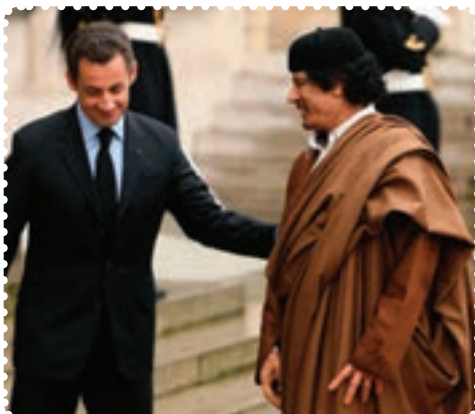
قذافی و سارکوزی رئیس جمهور پیشین فرانسه