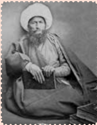
آیت‌الله حاج ملاعلی کنی

آیت‌الله ملاعلی کنی ملقب به رئیس‌المجتهدین (۱۱۸۴ - ۱۲۶۷ ش.) از علمای معروف و مبارز ایران در قرن سیزدهم و اوایل قرن چهاردهم