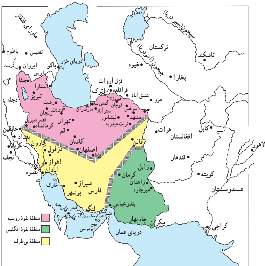
نقشه تقسیم ایران براساس قرارداد ۱۹۰۷

افغانستان که دارای ارزش حیاتی برای دفاع از هند بود، قلمرو نفوذ انگلستان مقرر گردید. قسمت سوم که شامل کویرها و بیابان‌های بی‌آب و علف بود، منطقه بی‌طرف و متعلق به ایران شناخته شد. منظور از این کار هم آن بود که دو دولت تا حدودی از یکدیگر فاصله بگیرند و از برخوردهای احتمالی بین آنها، جلوگیری شود.